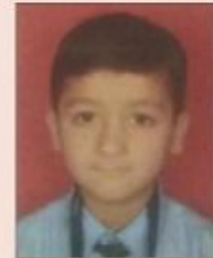
Krishna Shadi Class-5 th