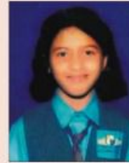
Hrutu Bhalchakra Class-7B